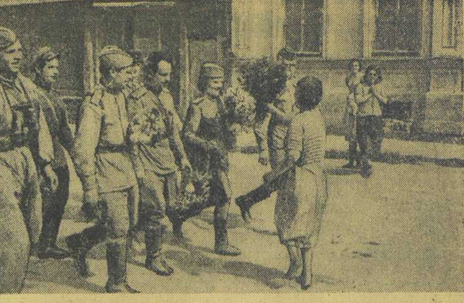
В ОРЛЕ. 1. Артиллеристы выбивают остатки гитлеровцев из западной части города. 2. Отступающая, немцы взорвали и сожгли лучшие здания города, горит дом Государственного банка. 3. Жители встречают бойцов и командиров Красной Армии с цветами.